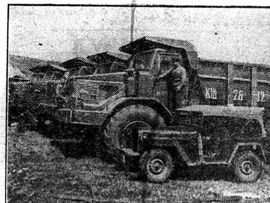
A Szovjetunióban nagymértékben gépesítették a gyapot betakarítását. Évről-évre több gyapotbetakarító gép végzi el a „fehér arany” begyűjtését. Képeink a sztálinabádi gép- és traktorállomás 2. számú telepén a munkára kész új gyapotbetakarító gépeket mutatja be.