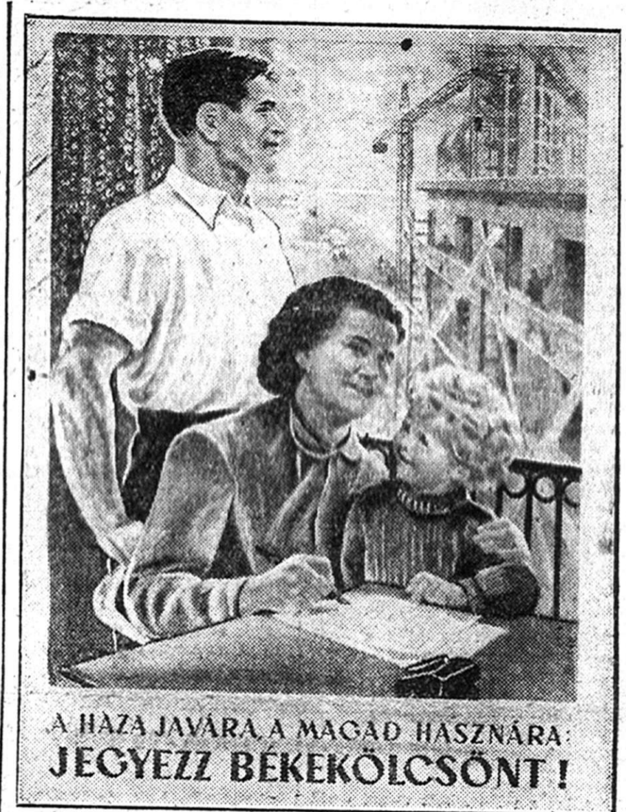
A HAZA JAVÁRA, A MAGAD HASZNÁRA: JEGYEZZ BÉKEKÖLCSÖNT!

Népgazdaságunk nagy feladatainak megoldását népünk nemesen a munka frontján vitte győzelemre, de egyén megalkarításával, államkölcsönjegyzésével és túljegyzésével is. Dolgozóink saját tapasztalataikból tudják, hogy a kölcsönjegyzés gyümölcsöző befektetés, melynek minden fillérje visszatérül és hűségeesen kamatozik az ország és az egyes dolgozók javára. Az a lelkesedés, amellyel dolgozóink